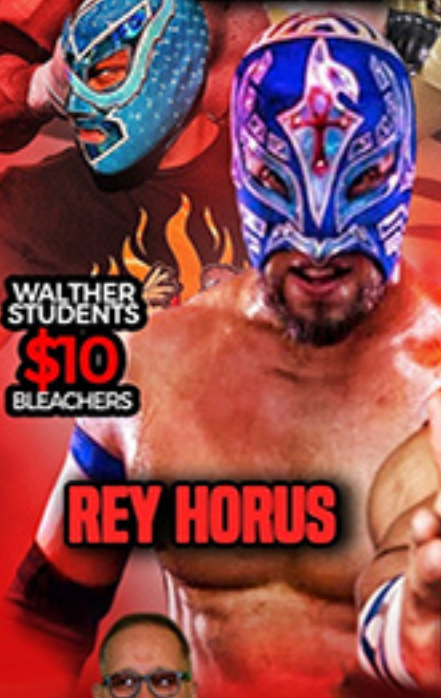
WALTHER STUDENTS $10 BLEACHERS