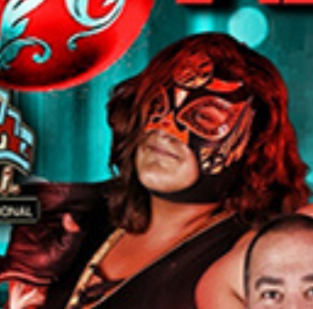
SAM ADONIS PUMA KING ONT AZUL